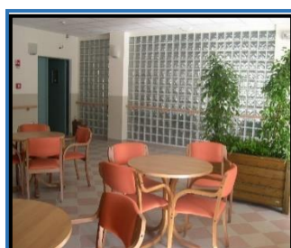
La zona bar

La Struttura, di nuova costruzione, è molto luminosa e confortevole. Consta di 4 piani e dispone di un giardino progettato per favorire gli spostamenti autonomi delle persone non autosufficienti e per fornire stimoli sensoriali adeguati alle persone con deterioramento cognitivo. Per migliorare la qualità della vita degli Ospiti sono stati predisposti spazi comuni attrezzati e di facile accesso e camere a uno, due o tre letti, il tutto Strutturato e organizzato per facilitare la socializzazione e la vita di comunità, senza negare la privacy a chi la desidera.