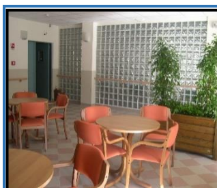
La zona bar

La Struttura, di nuova costruzione, è molto luminosa e confortevole. Consta di 4 piani e dispone di un giardino progettato per favorire gli spostamenti autonomi delle persone non autosufficienti e per fornire stimoli sensoriali adeguati alle persone con deterioramento cognitivo. Per migliorare la qualità della vita degli Ospiti sono stati predisposti spazi comuni attrezzati e di facile accesso e camere a uno, due o tre letti, il tutto Strutturato e organizzato per facilitare la socializzazione e la vita di comunità, senza negare la privacy a chi la desidera.